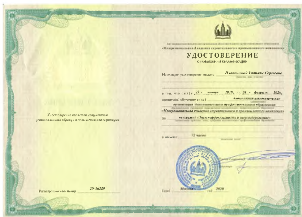
Удостоверение о повышении квалификации специалистов-энергоаудиторов