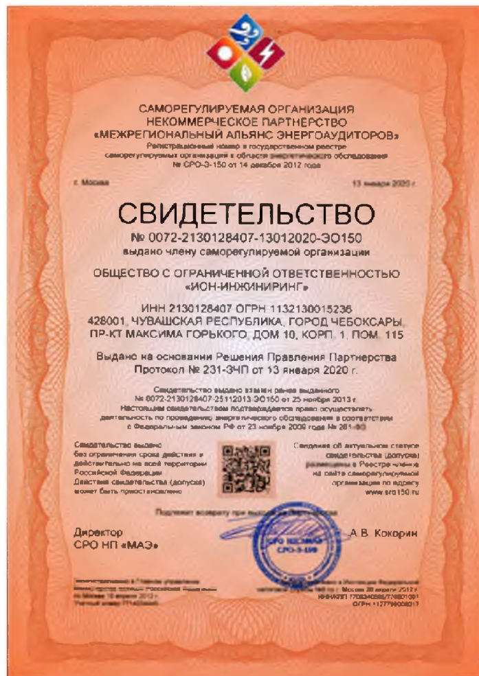
Свидетельство о допуске к работам в области энергетического обследования